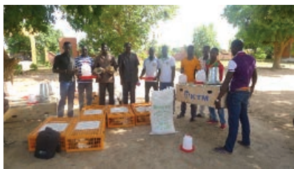
Remise de kits d'élevage dans la commune rurale de Komsilga en présence du SG de la mairie (4ème de la gauche vers la droite)

Au regard des objectifs recherchés et pour permettre une meilleure appropriation des outils