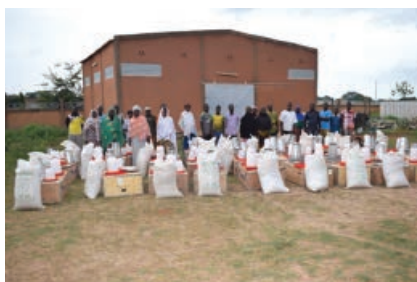
Distribution de kits d'élevage dans la commune rurale de Tanghin-Dassouri

Une des partitions des jeunes formés était de construire des poulaillers afin de pouvoir accueillir les poules et les équipements qui leur seront offerts.