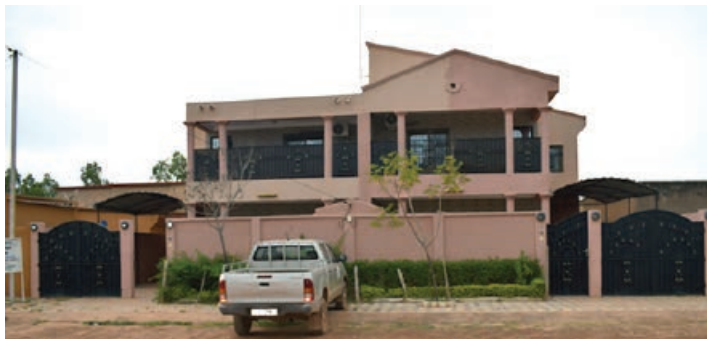
Situation géographique à Wayalghin

L'Agence pour la Promotion de la petite et Moyenne Entreprise Agriculture et Artisanat (APME.2A) informe ses partenaires et collaborateurs, qu'elle a aménagé dans ses nouveaux locaux sis au quartier Wayalghin de Ouagadougou depuis le mois de mai 2017.