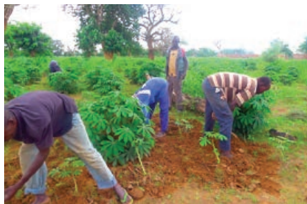
Champ de manioc.

Pour cette campagne 2017, 400 000 boutures de manioc ont été octroyées aux producteurs, soit 250 000 boutures pour le Sanematenga et 150 000 boutures pour les producteurs de Loumbila pour une superficie d'environ 60 hectares de terres clôturées par le projet au