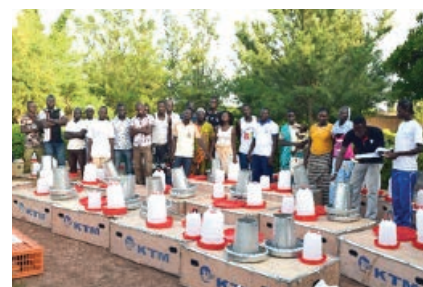
Distribution de kits d'élevage dans la commune rurale de Koubri

A terme, au minimum 250 jeunes des régions du Centre-Est, du Centre et du Plateau central devraient être bien formés en technique d'élevage de la volaille locale, en entrepreneuriat et en technique de commercialisation des produits d'élevage.