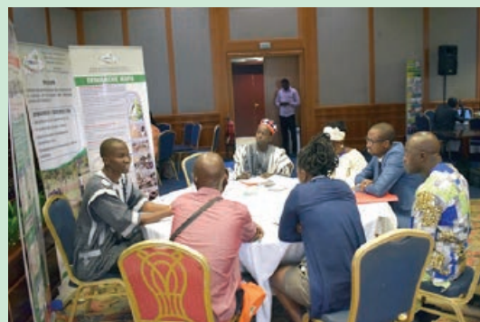
Table ronde de APME.2A.

Le 6 juillet 2017 s'est tenue à l'hôtel Laïco à Ouagadougou 2000, la foire sur le projet de renforcement des Capacités pour les Systèmes d'Innovations Agricole (CDAIS). APME.2A en tant que structure de développement des innovations a présenté la démarche ESOP et la démarche NAFA qui sont deux innovations majeures qui visent à améliorer la performance des exploitations agricoles et des entreprises agro-alimentaires. Ce marché a réuni plus d'une centaine de participants et une vingtaine de structures qui ont présentés des initiatives pour le développement réel du monde rural.