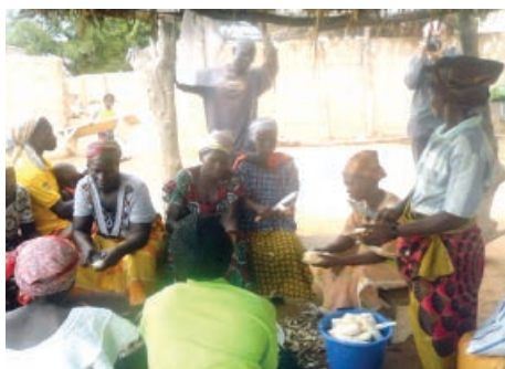
Des femmes épluchant du manioc.

Pour cette campagne 2017, 400 000 boutures de manioc ont été octroyées aux producteurs, soit 250 000 boutures pour le Sanematenga et 150 000 boutures pour les producteurs de Loumbila pour une superficie d'environ 60 hectares de terres clôturées par le projet au