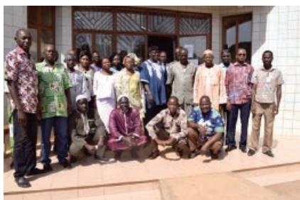
Photo de famille à l'issue de la rencontre.

L'agence pour la Promotion de la petite et Moyenne Entreprise/Agriculture et Artisanat (APME.2A) et ses partenaires, la Confédération Paysanne du Faso (CPF) et le Comité Interprofessionnel de la Filière Oignon du Burkina (CIFOB) ont lancé le 25/07/17 à l'ABMAQ à Ouagadougou projet intitulé «Appui à la production durable et compétitive de l'oignon au Burkina Faso». Ce projet est financé par : Action for Farmers Organisation in West Africa (JAFOWA) et sera exécuté de janvier 2017 à décembre 2018 dans les provinces du Yatenga, Lorum, Passoré et Sanguié au profit de 300 exploitants horticoles familiaux. L'objectif