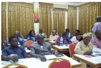
Une vue des participants à l'atelier.

L'agence pour la Promotion de la petite et Moyenne Entreprise/Agriculture et Artisanat (APME.2A) et ses partenaires, la Confédération Paysanne du Faso (CPF) et le Comité Interprofessionnel de la Filière Oignon du Burkina (CIFOB) ont lancé le 25/07/17 à l'ABMAQ à Ouagadougou projet intitulé «Appui à la production durable et compétitive de l'oignon au Burkina Faso». Ce projet est financé par : Action for Farmers Organisation in West Africa (JAFOWA) et sera exécuté de janvier 2017 à décembre 2018 dans les provinces du Yatenga, Lorum, Passoré et Sanguié au profit de 300 exploitants horticoles familiaux. L'objectif