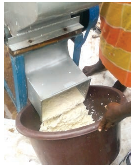
Patte de manioc.

Ces activités participent à l'augmentation de l'offre d'akiéké made in Burkina Faso et au renforcement de la résilience d'environ 1524 producteurs.