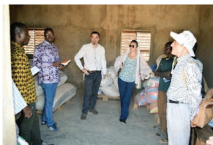
Séance de concertation.

Du 05 au 06 mars 2018, APME.2A, l'Union Européenne et l'ONG Gret ont effectué une mission de visite terrain dans le Plateau Central plus précisément dans l'Oubritenga qui est une des zones d'intervention du projet Go-In. Cette mission s'inscrivait dans le cadre du suivi des activités du projet Go-In, et plus particulièrement celles du volet niébé mises en œuvre par APME.2A et FERT.