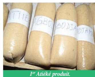
1 er Atiéké produit.