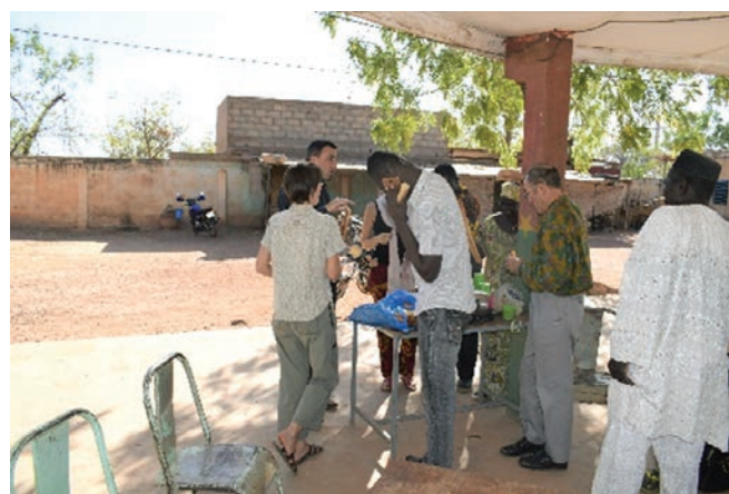
Dégustation du pain de niébé.

Après ces échanges, les partenaires (UE, Gret) ont jugé satisfaisants les taux de réalisations des activités du projet mis en œuvre par APME.2A dans sa zone et ce, pendant une première année de démarrage du projet. Ces partenaires ont par la suite encouragé APME.2A à poursuivre la dynamique tout en veillant à anticiper sur les sujets de capitalisation.